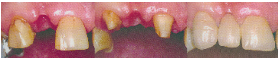
Fig.5 Prótesis fija dentosoportada