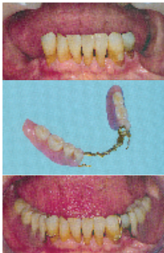
Fig.2 Prótesis esquelética