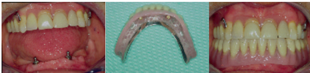
Fig.4 Encía desdentada con dos implantes. Prótesis implantoreténida/sobredentadura