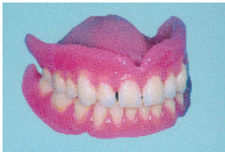
Fig.1 Prótesis completa clásica

Por lo tanto, es recomendable que Vd. reponga los dientes que pierda , a ser posible los veintiocho (y especialmente los veinticuatro) más anteriores. Sólo las muelas del juicio son realmente prescindibles.